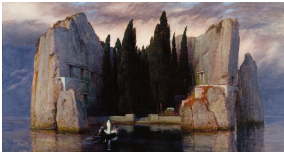
Arnold Böcklin - Die Toteninsel III (Alte Nationalgalerie, Berlin)

Συμφωνικό Ποίημα για ορχήστρα σε λα ελάσσονα, έργο 29